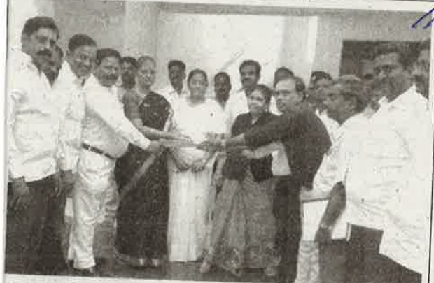
திண்டிவனத்தில் புதிதாக கட்டப்பட்ட ஒருங்கிணைந்த நீதிமன்ற கட்டிடம்: நீதித்துறையிடம் ஒப்படைப்பு