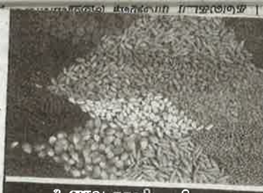
உணவு தானிய விலை

இப்பயிற்சியில் மருத்துவ, பொறியியல் மற்றும் கலை மற்றும் அறிவியல் கல்லூரி பேராசிரியர்கள், விரிவுரையாளர்கள், பாலிடெக்னிக், ஐ.டி.ஐ, பாரா மெடிக்கல் கல்வி நிறுவனம், ஆசிரியர் பயிற்சி நிறுவனம், மாவட்ட வேலைவாய்ப்பு அலுவலக பயிற்சியாளர்கள் மற்றும் பள்ளிக்கல்வித்துறை சார்ந்த கருத்தாளர்கள் ஆகியோரால் சிறப்பு வழிகாட்டுதல் நிகழ்ச்சி நடைபெறவுள்ளது. எனவே, மார்ச் 2017ல் பொதுத்தேர்வு எழுதிய 10 மற்றும் 12ம் வகுப்பு மாணவ மாணவியர்கள் தாங்கள் பயின்ற பள்ளி தலைமை ஆசிரியரை தொடர்புக்கொண்டு இந்நிகழ்ச்சியில் கலந்துகொண்டு பயனடையுமாறு கேட்டுக்கொள்ளப்படுகிறார்கள்.